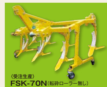
〈受注生産〉 FSK-70N(転砕ローラー無し)