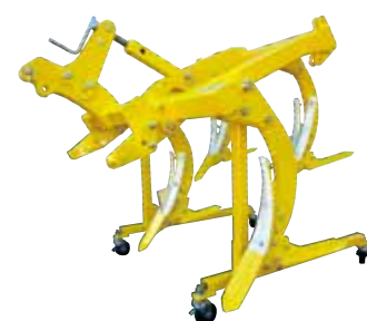
〈受注生産〉 FSK-40N (転砕ローラー無し)