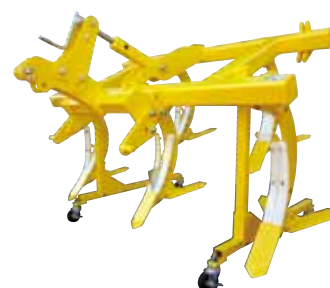
〈受注生産〉 FSK-50N (転砕ローラー無し)